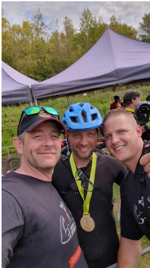
Het Team van 2023

We hebben genoten. Nu alles rustig laten bezinken en uitrusten. 😊